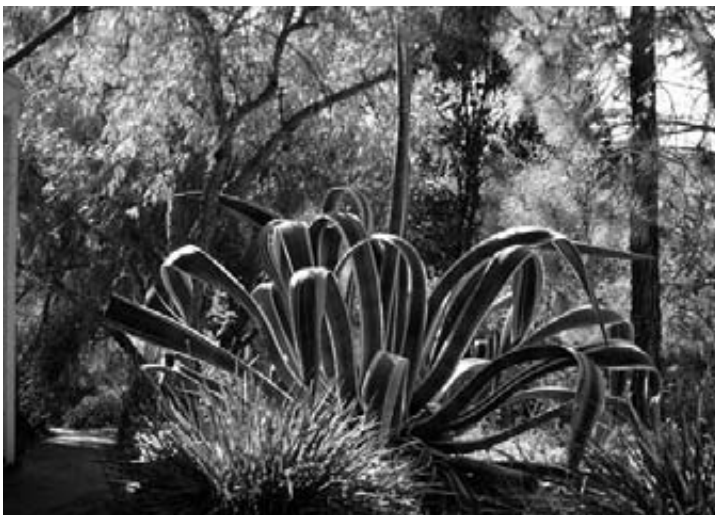
De yucca in Krotona, Californië

De cover van nummer 6 is een merk- waardige afbeelding van detail en vaag- heid: een foto van de doorsnee van een blad met de achtergrond-delen uit focus. De dialoog tussen de voor- en achterkant wordt gestimuleerd door het zwarte vier- kantje en de witte cirkel: abstracte vormen als symbolen voor ideeën die enigszins open zijn