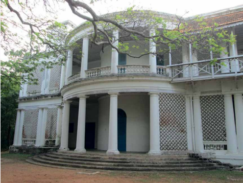
Blavatsky Bungalow *