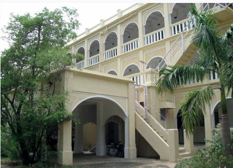
Leadbeater Chambers *