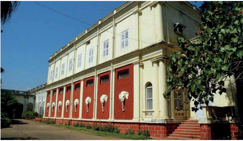
International Headquarters *