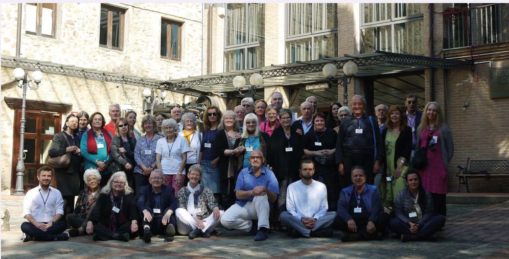
Foto: Deelnemers aan de school Memento Mori