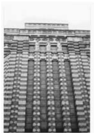
De Nederlandsche Handel-Maatschappij aan de Vijzelstraat in Amsterdam

mengde vrijmetselarij en de rozenkruiserij omvatte.