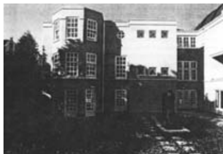
Het complex in Den Haag, De Ruyterstraat.

het gebouw. Het archief en de Rijksdienst voor de Monumentenzorg zijn met elkaar in strijd verwickeld over onder meer het openen van de gevel op straatniveau, om het gebouw toegankelijker te laten ogen. Maar welke argumenten moeten beide partijen aandragen voor hun voor of tegen, wanneer De Bazels eigen ideeën daarover niet bekend zijn? Of zijn die wel bekend, maar worden ze niet gezien? Wie De Bazels kunst en architectuur wil begrijpen, moet allereerst zijn theosofische levensovertuiging in ogenschouw nemen. Want hoewel vele kunstenaars en architecten in De Bazels tijd lid zijn geweest van de Theosofische Vereniging, zijn er weinigen te vinden die zo overtuigd vanuit de theosofie hebben gedacht en gewerkt. En vanuit de gemengde vrijmetselarij, moet daaraan worden toegevoegd, want hij was al vroeg lid van Le Droit Humain en bleef dat ook zijn hele leven. Een speciale opdracht voor hem was dan ook de bouw van het complex in Den Haag in opdracht van de Theosofia Stichting in 1915, dat zowel het Haags theosofisch centrum moest worden, maar ook een tempel van de ge-