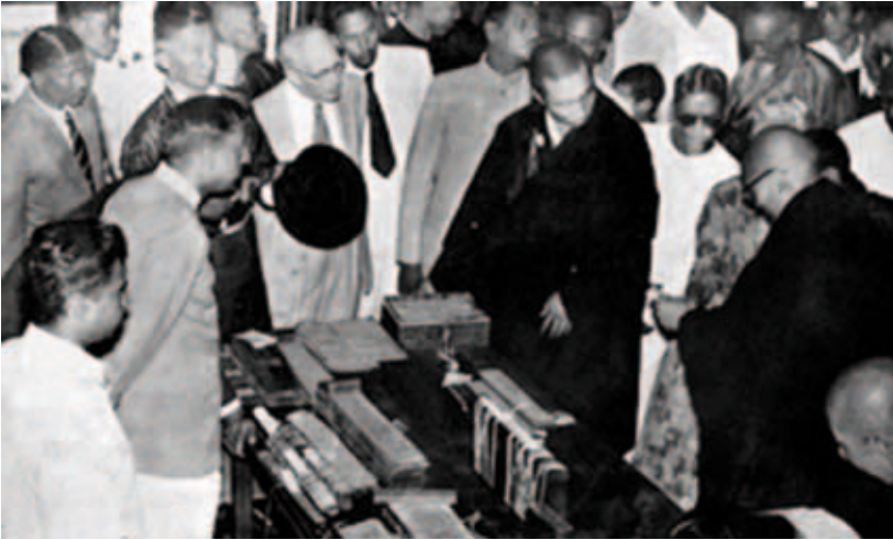
De Dalai Lama en de Panchen Lama in de Adyar Bibliothek

Om vijf uur verwelkomde de President de Dalai Lama door hem bij de trilithon – die dienst doet als formele ingang van de Banyanboom – te omkranen. Zijne Heiligheid de Dalai Lama en zijn gezelschap, de President en andere voornamen gingen toen heel langzaam naar de theetafel, terwijl Zijne Heiligheid elke paar stappen halt hield voor een introductie; heel handig voor de amateurfotografen. Na de thee, welke bij deze gelegenheid een combinatie was van zowel Westers als Indisch voedsel, heette de President de Dalai Lama formeel welkom en stelde hij Hem voor aan de andere gasten. In aanwezigheid van de President ging de Dalai Lama van tafel tot tafel om elke gast individueel te begroeten.