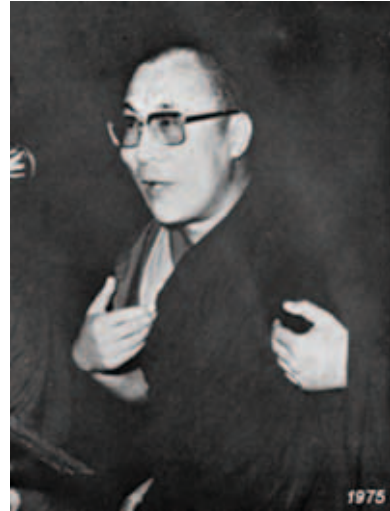
De Dalai Lama in 1975