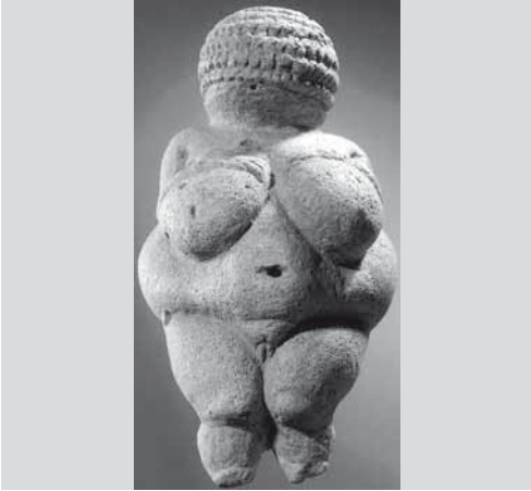
Venus van Willendorf

Na het einde van de IJstijd vinden we in Neolithische culturen waarin vroege landbouw bedreven wordt nog steeds Oermoederbeelden of clanmoeder-beelden terug; zij brengen de eerste moeders van de clan en grootfamilie in beeld. In talrijke beelden is zij androgyn en toont zowel mannelijke als vrouwelijke trekken. Dit staat symbool voor het egalitaire karakter van deze culturen waarin mannelijk en vrouwelijk nog met elkaar in harmonie en balans zijn. Er zijn eveneens voormoederbeelden in de Jordaanvallei en Mesopotamië gevonden. Ook in de megalithische cultuur in Europa vinden we deze terug.