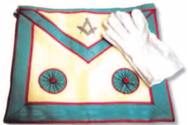
Handschoenen en Schootsvel

Vanuit een diepe overtuiging zeg ik: "ALLES". Maar omdat vrijmetselaars niet houden van dogma's, is het toch niet zo'n gemakkelijke vraag, want: bestaat er wel zoiets als een ziel?