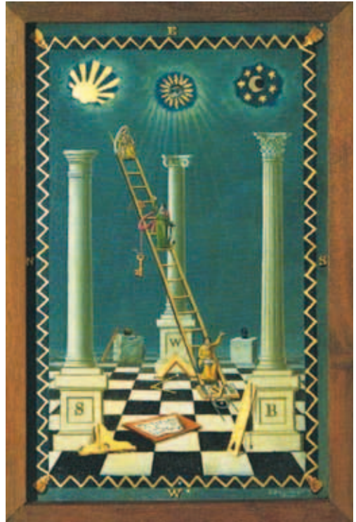
De drie Zuilen van Wijsheid, Kracht en Schoonheid

Wat hield dat verschil in? In de godenwereld van de Eerste Tempel was er de Scheppergod [4] van de Hebreëuwen, met als zijn metgezel de Koningin van de Hemel Ashera (waarschijnlijk zijn