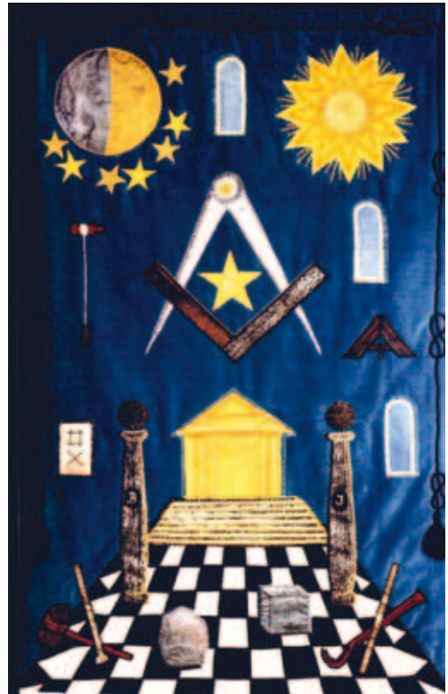
Tableau van Loge nr. 91 'Georges Martin I, Den Haag'

Het is daarom denk ik veelzeggend dat de maçonnieke arbeid in de Tem-