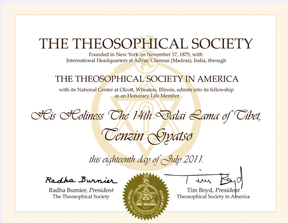
Foto: Afbeelding van het bewijs van lidmaatschap van de Dalai lama