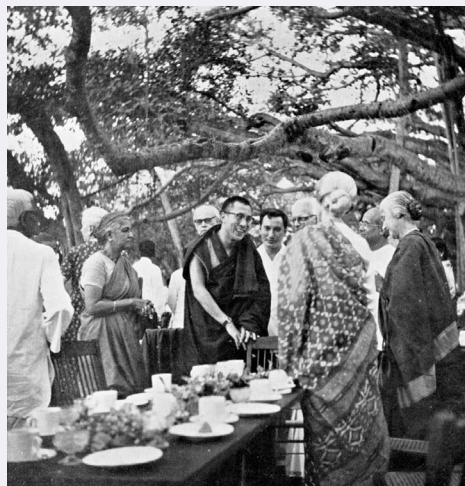
Foto: De Dalai Lama op de tea party onder de Banyan-boom