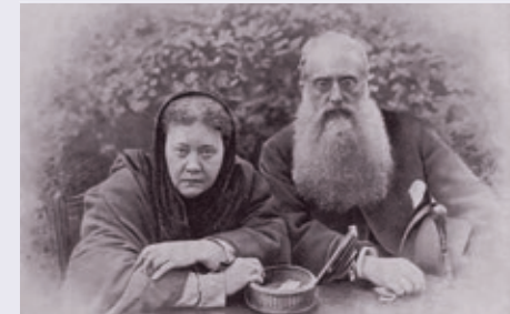
Foto: H.P. Blavatsky en H.S. Olcott

Met deze instelling meende Olcott dat spiritualistische verschijnselen waarvan hij het gevoel had dat deze echt waren, eveneens diepgaand onderzocht moesten worden. Voor mediums was hij een plaag: hij zette een groot aantal instrumenten op om er zeker van te zijn dat er geen bedrog plaatsvond en om uit te vinden wat er echt gebeurde. Hij stelde andere waarnemers op in een poging om bedrog te ontmaskeren. Toen hij HPB ontmoette ontstond er een band tussen hen, voor de rest van hun leven.