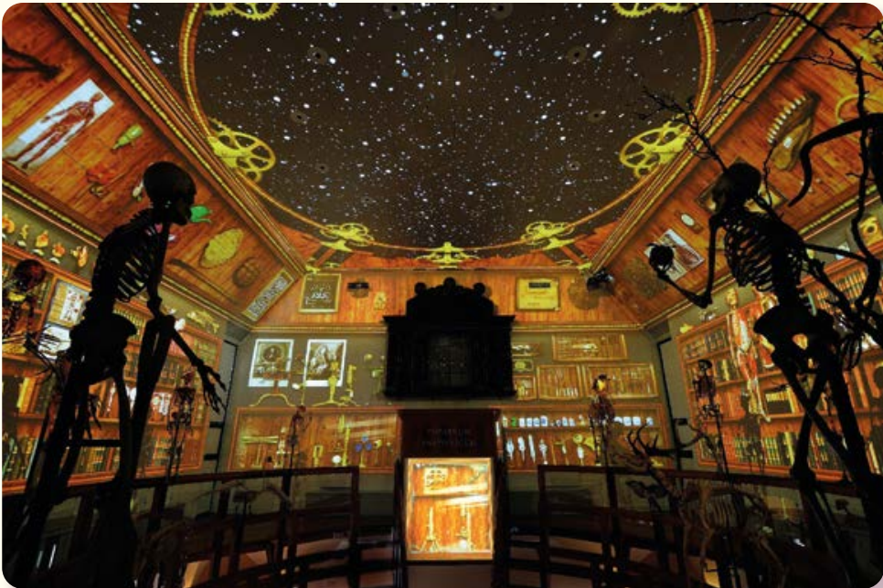
Theatrum Anatomicum in Museum Boerhaave in Leiden