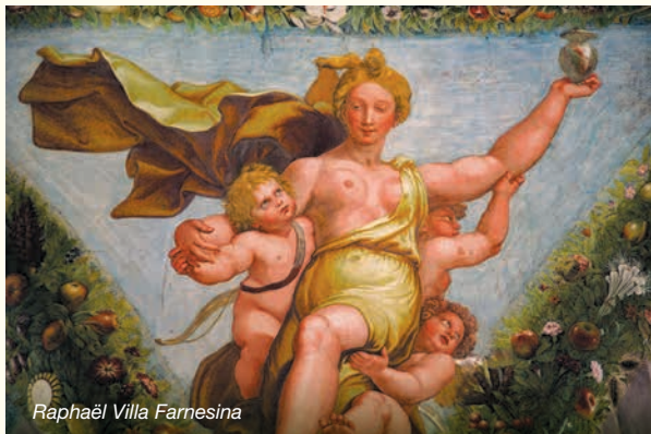
Raphaël Villa Farnesina