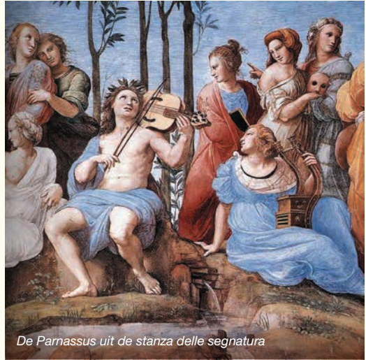
De Parnassus uit de stanza delle segnatura

Bij Michelangelo wordt de Marskracht in grandiose monolieten gebeiteld. Een beeldende uitwerking in steen en op fresco's die overheersend en rigourees van aanpak is en daardoor ook bijna onbereikbaar voor de beschouwer. Mars poneert zich sterk. Venus is meer verbindend, lossier, zachter dan Mars. Raphaël's portretten en Madonna's tonen de liefdesgevoelens waarmee ze gemaakt zijn. In zijn kunstwerken wordt de liefde en de menselijke waardigheid meer zichtbaar. Natuurlijk zien we ook pittigere thema's terug in zijn historiestukken, zoals "De verdrijving van Heliodorus uit de tempel", maar zijn