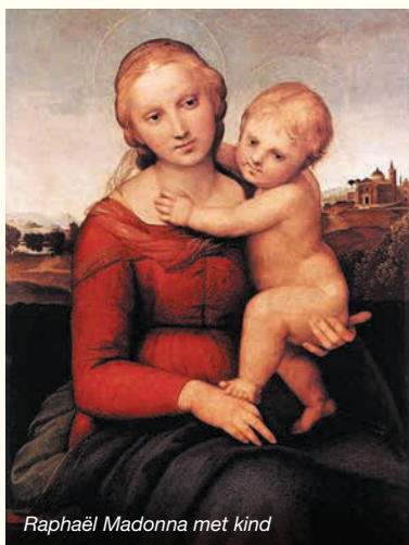
Raphaël Madonna met kind

met mannen die beducht waren stond hij op goede voet. Zijn eigen werk kon hij in de steek laten om bijvoorbeeld zijn mede kunstenaars te helpen met een probleem. Als hij naar het hof ging was hij altijd omringd door veel begeleidende kunstenaars. Burgers konden in die tijd ook tot kardinaal benoemd worden en Raphaël was vanwege zijn vrome gedrag, een serieuze kandidaat.