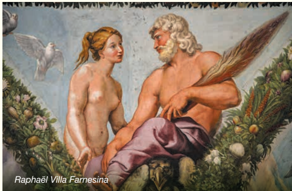
Raphaël Villa Farnesina

bekende Madonna's waarvan hij er zo'n 35 maakte, zijn bij uitstek Venusscheppingen. Het is mooi om te zien hoe anders de Zonconjuncties van Mars en Venus bij beide kunstenaars uitwerken.