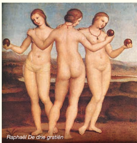
Raphaël De drie gratiën