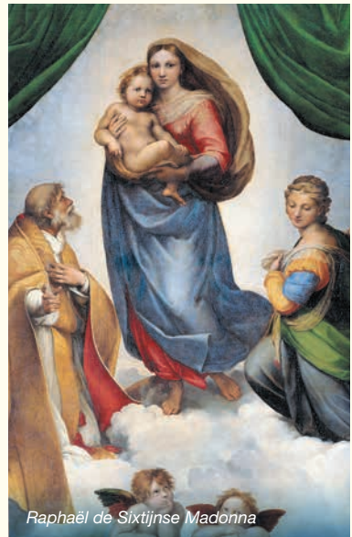
Raphaël de Sixtijnse Madonna