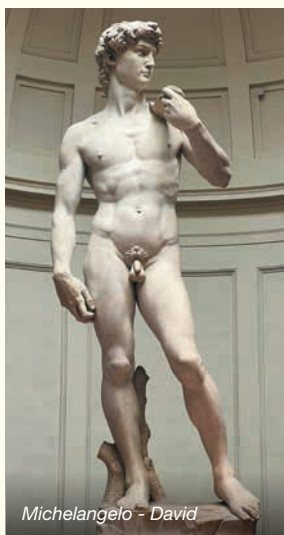
Michelangelo - David

eigen ogen gezien heeft. Hij ging te werk met zoveel energie en vuur, dat ik dacht dat het marmer in stukken zou vliegen. Met één slag hieuw hij stukken af van drie of vier vingers dik en zo precies op het aangegeven punt, dat als er maar iets meer marmer was meegegaan, hij misschien het gehele werk had bedorven. Hij gebruikte geen dril, met vuist en kauwbeitel ging hij te werk en daar heb je kracht voor nodig.