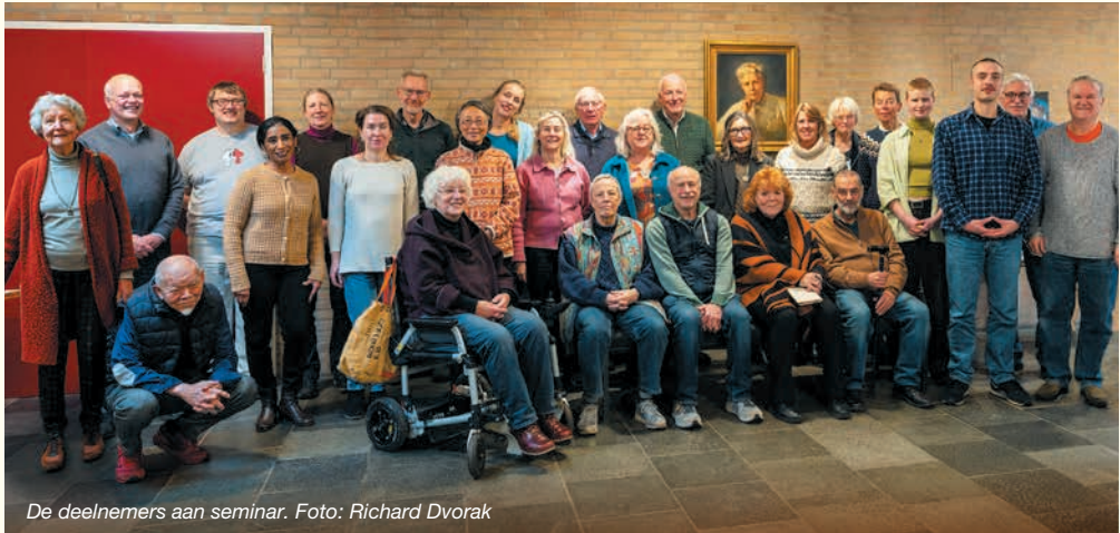
De deelnemers aan seminar.